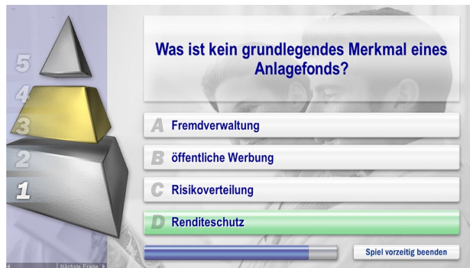
Spielerisch die Message in den Mittelpunkt gesetzt: Finanzfragen beantworten bei Julius Bär

Über die Funktion des innovativen Eyecatchers hinaus hat das Spiel noch weitere wichtige Vorteile: Der Messebesucher setzt sich aktiv mit der Themenwelt des Ausstellers auseinander und wird so die Message besser aufnehmen und lange behalten. Zudem ist er dank des positiven Spielerlebnisses gut ansprechbar für das Standpersonal; es kommt in entspannter Ambiance zum Kundengespräch.