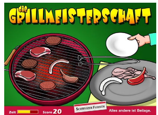
Steaks grillieren bei ProViande