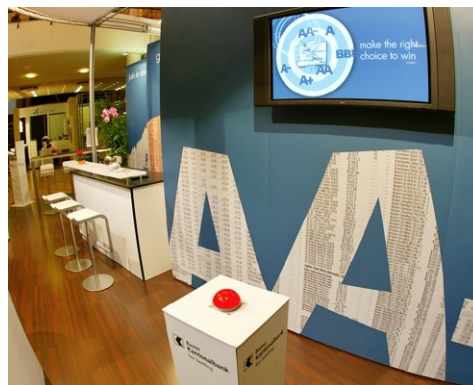
Auf den Buzzer hauen und Dart-Pfeile werfen für die Basler Kantonalbank